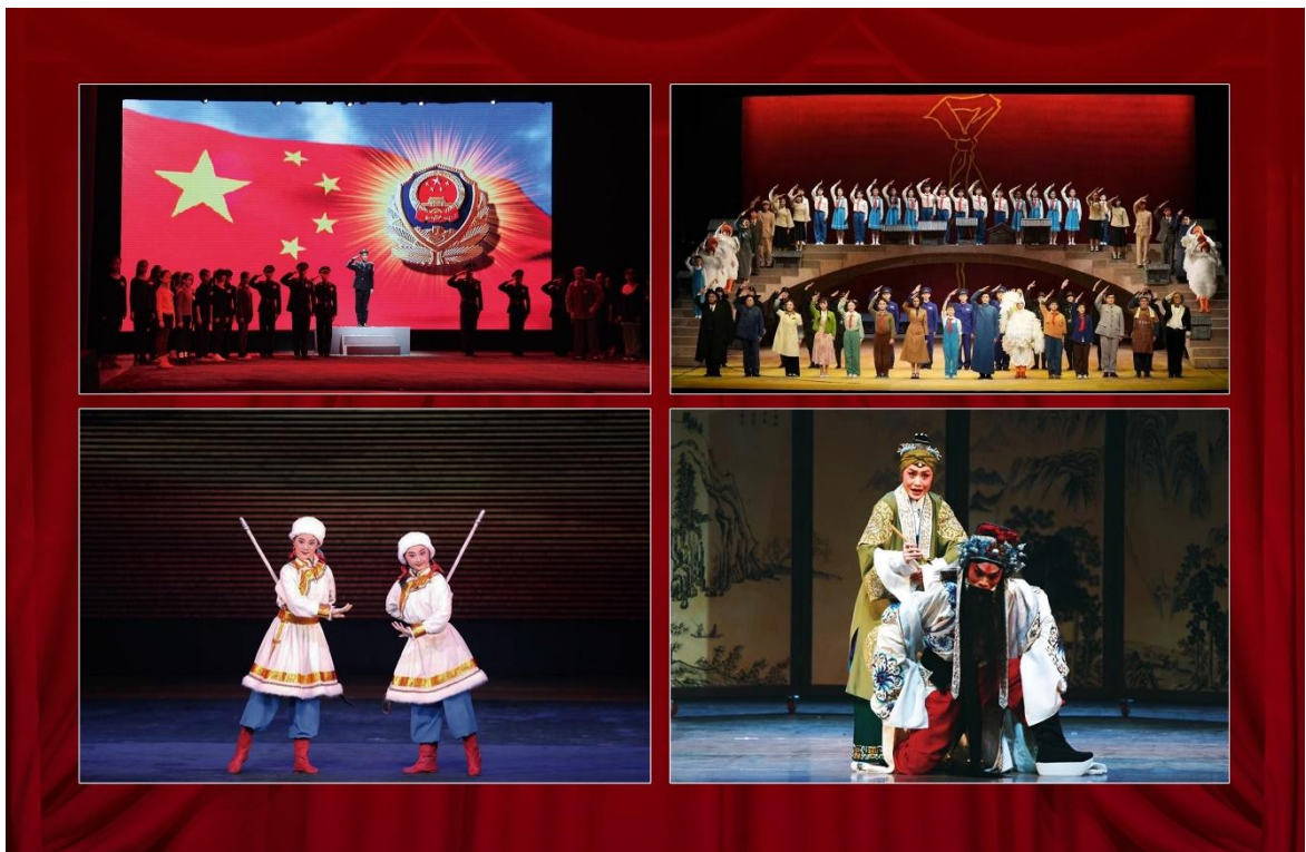
图 6：校团联合创演剧目《长霞》《心愿》《草原小姐妹》《岳母刺字》