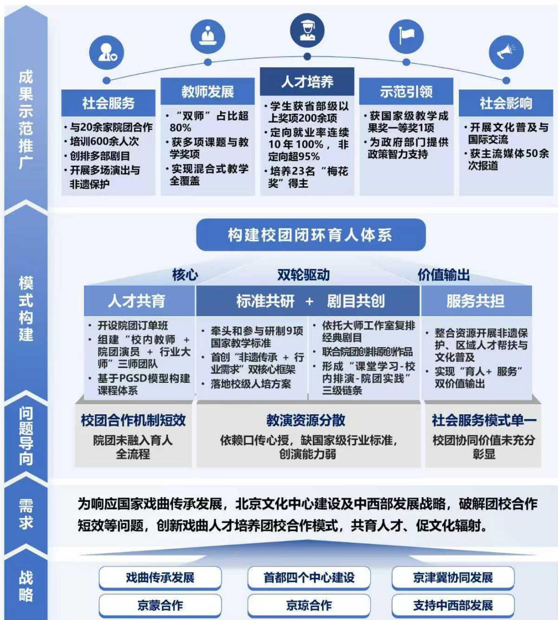
图 1：人才培养模式结构图

目，开展多场演出；示范引领作用彰显，获国家级教学成果奖一等奖 1 项，分享校团合作标准建设经验，科研项目为政府提供政策制定的智力支持；在国际，赴多国开展文化交流活动，推动戏曲艺术国际传播；获新华社、《人民日报》等主流媒体多次报道，提升戏曲文化影响力。成果推动戏曲教育从“口传心授”向标准化转变，为传统戏曲活态传承与中华优秀传统文化发展注入动力，也为全国戏曲职业院校校团合作模式创新提供了可借鉴的范例。