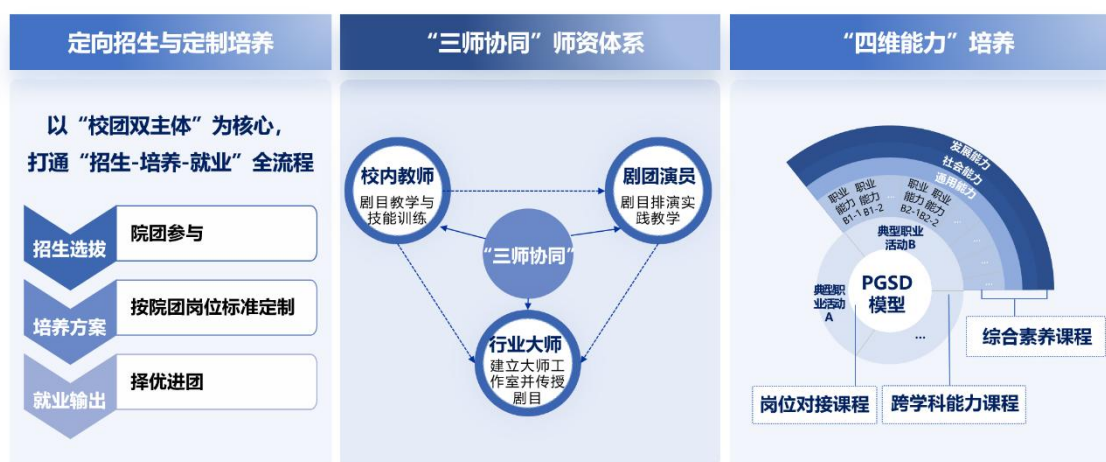
图 2：人才共育结构图

机制保障上，建立长期协同制度，与北京京剧院、中国评剧院等知名院团签订长期合作协议，明确“人才共育、资源共享、服务共担”权责；建立常态化沟通机制，定期召开校团对接会，每学期开展人才培养质量评估，如进行毕业生岗位适配度调研，及时解决合作中的问题。