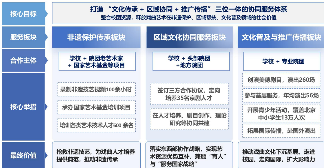
图 5：服务共担结构图

校团联合开展多元化文化服务，推动文化普及与推广传播。与北京京剧院、中国评剧院等院团，创演美德剧目《心愿》《长霞》《岳母刺字》等剧目，在京津冀演出 260 场，覆盖 13 万人次观众；年均参与“星火工程”等基层服务演出 56 场，服务基层群众 4000 余人。开展“最美少年传统艺术学习体验活动”，覆盖北京 13 万人次中小學生，“少儿戏剧场”成北京未成年人戏曲教育基地；还携手专业院团赴国外参加“中国戏曲文化周”，参与“欢乐春节”，扩大戏曲国际影响力。