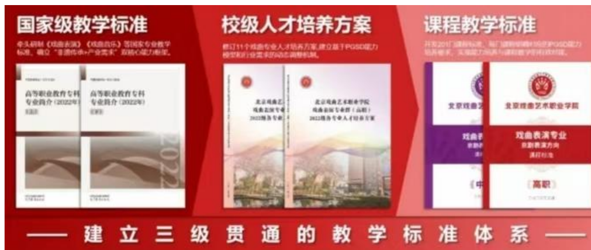
图 3：标准共研成果图

动态优化机制。建立“一年微调、三年修订”的动态调整机制。每年联合院团开展人才培养质量评估（如毕业生岗位适配度调研），每三年根据行业技术变革（如智能舞台技术应用）更新标准内容，确保标准始终与行业发展同步。