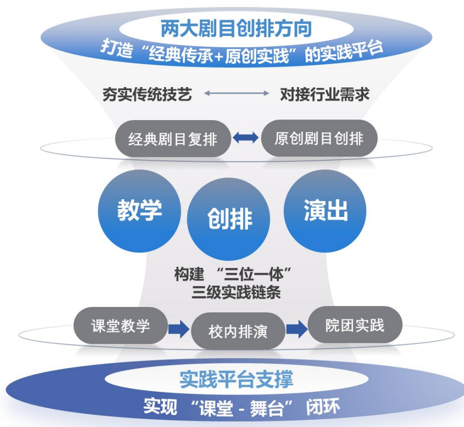
图 4：剧目共创结构图

实践平台支撑，实现“课堂-舞台”闭环：以校内“少儿戏剧场”（年均演出 117 场，学生参与率 100%）为基础，与北京京剧院、中国评剧院等共建 18 家校外实训基地，形成“课堂教学打基础、校内排演强技能、院团实践促提升”的三位一体的三级实践链条。学生在院团实习期间，直接参与商业演出、惠民演出等真实项目，年均实习演出 10 场，实战能力显著提升。