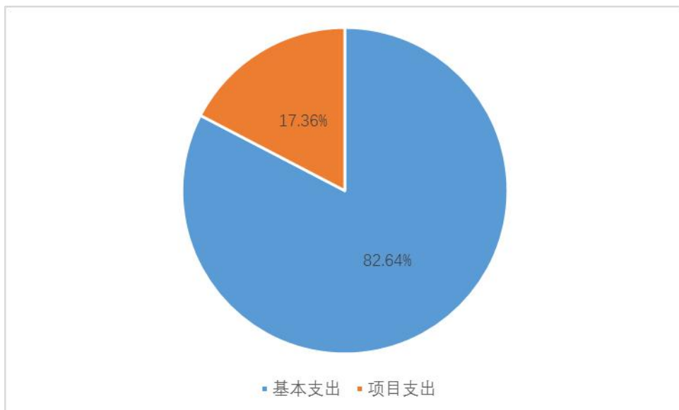
图 2：基本支出和项目支出情况